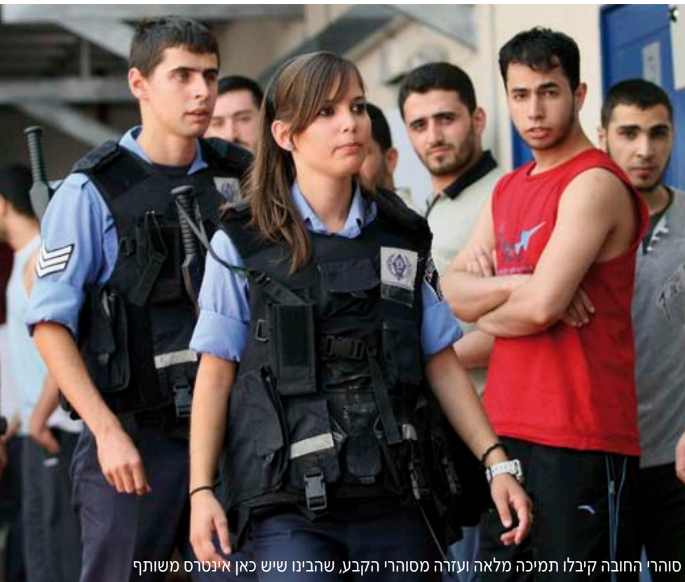
סוהרי החובה קיבלו תמיכה מלאה ועזרה מסוהרי הקבע, שהבינו שיש כאן אינטרס משותף

ההחלטה הראשונה שלו היתה להציף את המצב - שקיפות מלאה. סוהרי החובה הסרבנים נקראו לשיחות, לא רק במשרד אלא דווקא בפגישות אקראיות בשטח, כאילו בדרך אגב, אבל למעשה בצורה מאוד מכוונת. שלל התגובות שאסף היה הבסיס הראשוני לבניית מערך ארגוני-אנושי חדש. "הם אמרו לי: 'אנחנו פראירים', 'אתם מקבלים משכורת ואנחנו לא', 'אנחנו לא מתפרנסים, אז למה לעשות עוד?' 'דיתוק? להפך, נהיה שבועיים בבית ונוכל לעבוד'... וקנין, איש סדר וארגון במהותו, בעל משמעת ברזל, היה צריך לשפשף את עיניו כדי להאמין שסוהר חובה עומד ופולט את האמירות הללו. "הקשיים לא הסתיימו ביום אלא נמשכו על פני חודשים. אנשי הקבע שילמו את המחיר כשהצעירים פשוט לא הגיעו מהבית, סגרו טלפונים ולא ענו. הגענו לתורנויות שבת בלי חיילים. אנשי הקבע הוועקו ובאו, כי אנחנו חייבים 'לסגור' מספר קבוע של סוהרים". וקנין מודה: "לעיתים, בפן האישי, חשתי פשוט דחיה. חשבתי לעצמי: 'מי צריך אותם ואת הבעיות האלה'". אבל, היה ברור שהטיפול הוא לא רק בסוהרי החובה, אלא גם ביצירת אמון הדדי ושילוב עם סוהרי הקבע. היה לו חשוב לשרד ביטחון שניתן להפוך את הקערה על פיה, לגרום לאנשי הקבע לקבל את