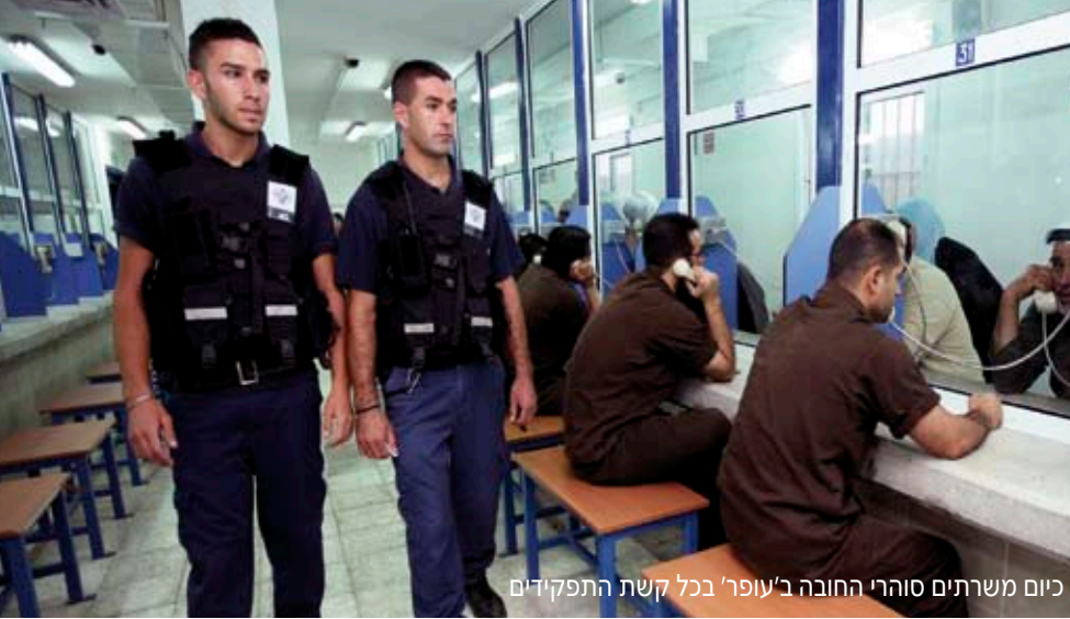
כיום משרתים סוהרי החובה ב'עופר' בכל קשת התפקידים

החייל עם טלוויזיה ומכשיר די.וי.די. - "המועדון הכי יפה במזרח התיכון", מתלהב וקנין. "המסר שלי היה 'להעמיד את הסוהר במרכז העשייה של בית הסוהר'. היה לי ברור שהביטחון של הכלא עובר דרך התנאים לסוהרים, לפני שהוא עובר דרך החומות". ענתבי: "במקביל התחלנו בפעולה הסברתית אצל סוהרי הקבע. בלילות בהם אנחנו מחויבים ללינה ביחידה - פעמיים בשבוע, זימנו סוהרי חובה לשיחות, ליקטנו את התלונות והבקשות ואז אספנו את סוהרי הקבע והעברנו להם את המסרים שעיקרם נגע לתחושת זלזול ואפליה לרעה בתפקידים.