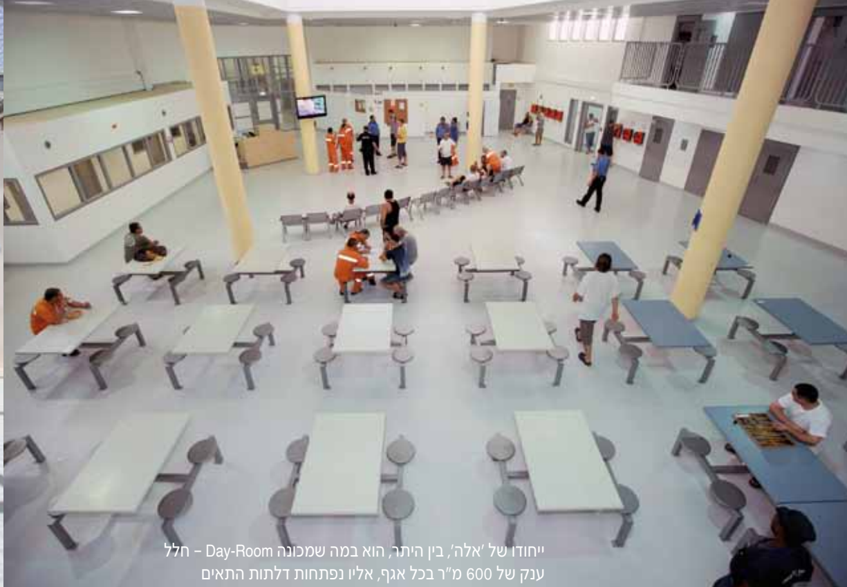
ייחודו של 'אלה', בין היתר, הוא במה שמכונה Day-Room - חלל ננק של 600 מ"ר בכל אגף, אליו נפתחות דלתות התאים

בית הסוהר בשלוש מילים: 'ראשון בין שווים', ציטוט של צ'רצ'יל. הכוונה היא לערך המוסף של 'אלה' על פניו בתי סוהר אחרים. אם נצליח, הוא יהיה כזה. מבחינתי, קליטת אסירי המשט באה בזמן. זה היה האתגר הראשון והמבחן הראשון של 'אלה' כ'חלון הראווה של שב"ס'."