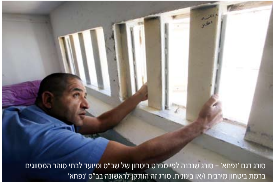
סורג דגם 'נפחא' - סורג שנבנה לפי מפרט ביטחון של שב"ס ומיועד לבתי סוהר המסווגים ברמת ביטחון מירבית ו/או בינונית. סורג זה הותקן לראשונה בב'ס 'נפחא'