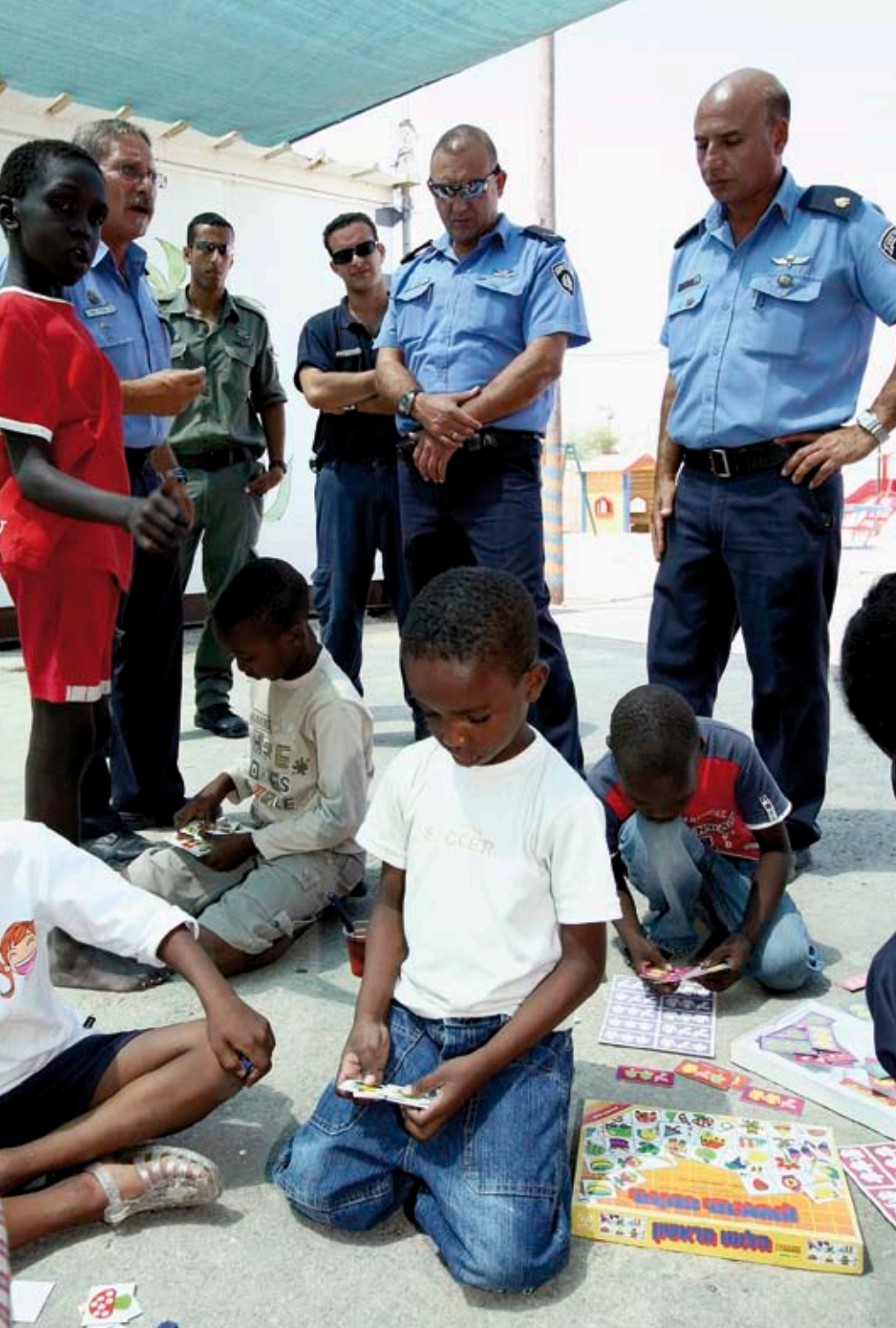
"הנציב ביקש שמקום המשמורת יהיה כמה שיותר הומאני. זו ההנחיה, וזה גם מה שמתאים ומתבקש, כיוון שאנחנו מחזיקים כאן נשים וילדים מגיל יום עד 18"

להיערך, כך גם המדינה לומדת. אני מניח שבסופו של דבר, תהיה חקיקה, יהיו אישורי שהייה זמניים, משהו יקרה. אצלנו ב'קציעות', זה בפירוש סידור זמני."