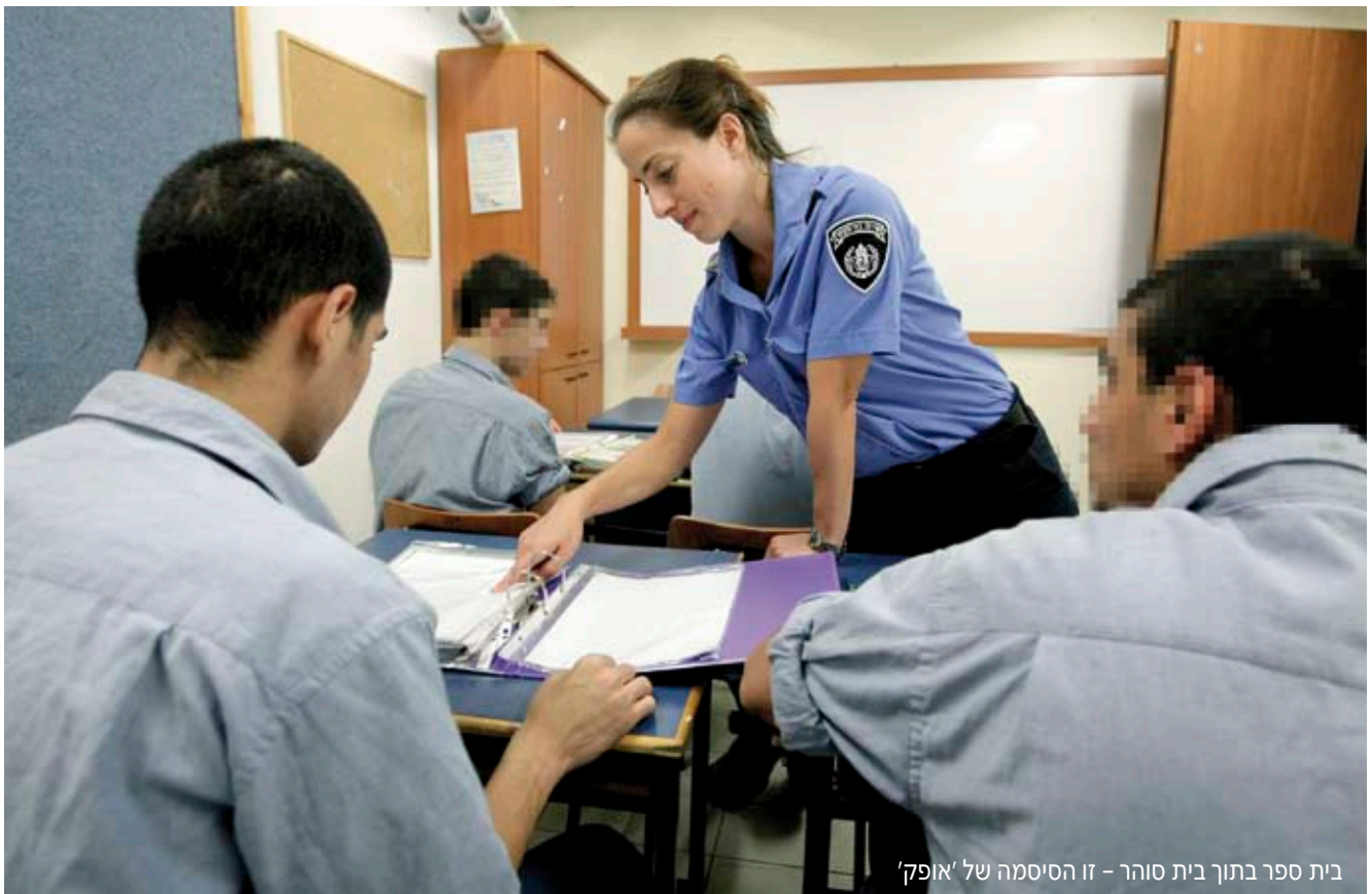
בית ספר בתוך בית סוהר - זו הסיסמה של 'אופק'

חוג התיאטרון הוא דוגמה טובה לכך. הנערים כותבים ומשחקים תפקידים השאובים מחוויות החיים שלהם עצמם. "באחת הפעמים, אחד הנערים בחר להציג דו-שיח עם אביו, שהחליט לנתק את הקשר אתו בגלל העבירה שעבר וגם בגלל שחזר בשאלה", אומרת רבינוביץ'. "הזמנו את המשפחה להצגה והאב הגיע. 'אבא', אמר לו הנער מעל הבמה, 'תקבל אותי, תסלח לי, אני בן אדם, עשיתי שינוי'. הנער חשש, אבל בסופו של דבר אביו סלח לו. בפעם אחרת, בחודש מרס האחרון, קבוצת התיאטרון שלנו הופיעה במסגרת פסטיבל הצגות לנוער בבת-ים. הנערים פשטו לפתע את 'מסיכות' העבריינים שלהם לקראת ההופעה ושאלו שאלות שמאפיינות את כל הנערים בגיל הזה: 'מה יקרה אם לא ימחאו לנו כפיים? אם לא יאהבו את ההצגה? אם יהיו שם בנות?' הרי אלה נערים שלא פוגשים בנות, הם שוהים בכלא בניס. פתאום העברייני נעלם, ובמקומו מתגלה הנער".