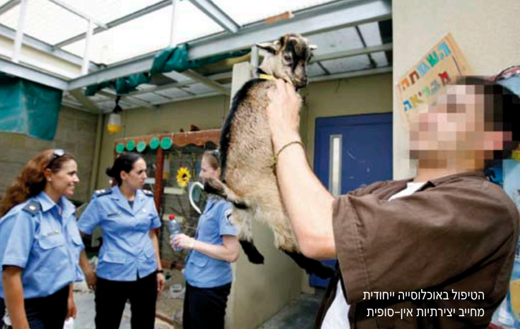
הטיפול באוכלוסייה ייחודית מחייב יצירתיות אין-סופית