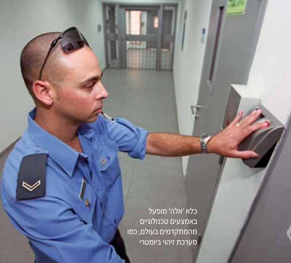
כלא 'אלה' מופעל באמצעים טכנולוגיים מהמתקדמים בעולם, כמו מערכת זיהוי ביומטרי