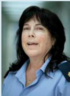
רב כלאי דורית דרוך

מבצעים לבין מפקדת אגף שבאה מהשטח - הוא חיבור שתורם להצלחת הפרויקט".