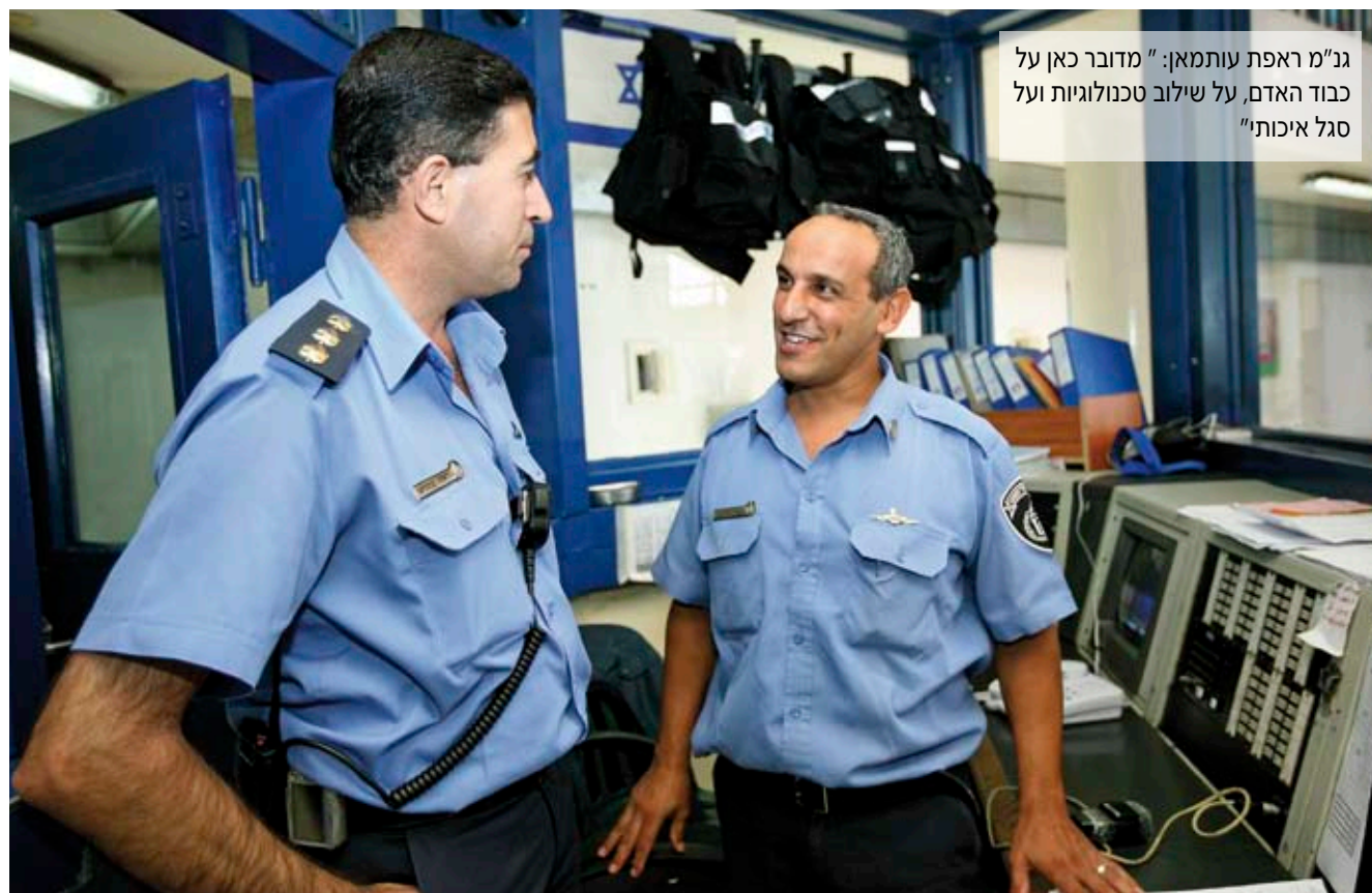
גנ"מ ראפת עותמאן: " מדובר כאן על כבוד האדם, על שילוב טכנולוגיות ועל סגל איכותי"

כבר מהכביש אפשר לזהות את מבני האבן הלבנים והמרחבים הפתוחים אשר אינם מסגירים את מה שבאמת מסתתר בין החומות. מרחוק אפשר לחשוב שבית מעצר 'הדרים' אינו אלא מבנה ציבורי, מתנ"ס או ספרייה, אבל סלילי התיל הדוקרני המקיפים את המתחם מגלים שפה, בכל זאת, מוחזקים אסירים ועצירים. הניגוד נמשך גם בין התפיסה האדריכלית - קירות לבנים ופתחי אור רחבים המזרימים אוויר צח - לבין הבריקה הבטחונית המוקפדת, הנכפית על כל הנכנס בשער החשמלי ועל כל רכב הנעצר לבדיקת גחון מדוקדקת. המאבטחים, מנומסים אבל ענייניים, מתמקדים בכל אחד מהנכנסים,